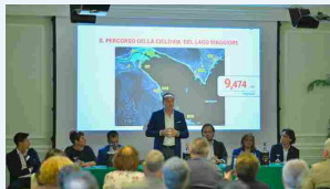
La conferenza stampa di presentazione delle tre ciclovie, nella foto il presidente del Piemonte Alberto Cirio

DIEGO MOLINO 01 Luglio 2023 alle 11:37 | 1 minuti di lettura